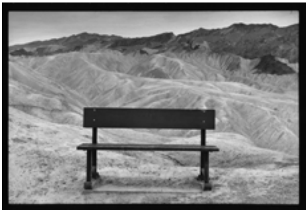
Photo : Zabriskie Point, Californie, 1982, Raymond Depardon

du 1 er au 23 avril au Musée Michel Ciry